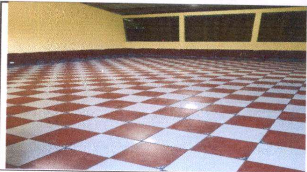
Foto 6: Sustitución de torta de concreto por piso cerámico en aula.

Observación: Si es necesario se pueden agregar hojas adicionales y actualizar el número de hojas.