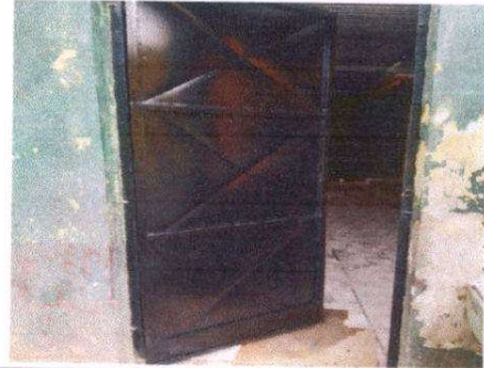
Foto 2: Sustitución de puerta de metal en sanitarios, aulas y cocina.