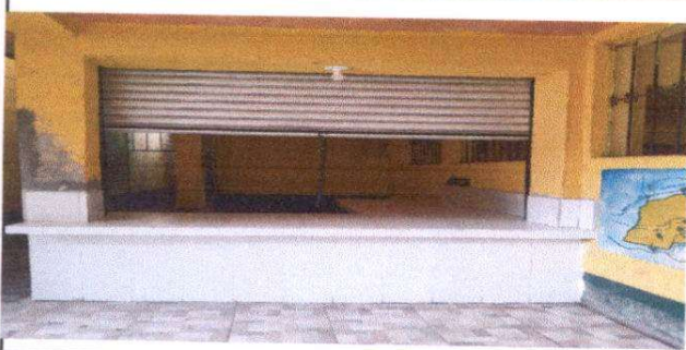
Foto 5: Suministro de mueble fijo de concreto, revestido de azulejo área exterior de cocina y sustitución de torta de concreto.