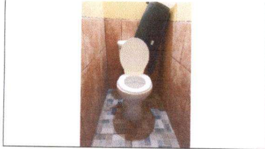
Foto1: Sustitución de inodoros.