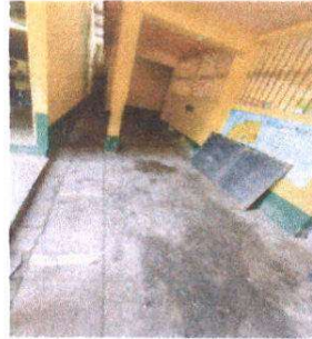
Foto 4: Sustitución de torta de concreto en área exterior de cocina. Suministro de mueble fijo de concreto revestido de azulejo área exterior de cocina