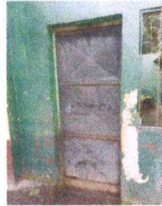
Foto 2: Sustitución de puerta de metal en sanitarios, aulas y cocina.