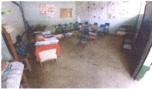
Foto 3: Sustitución de torta de concreto por piso cerámico en aulas. Pintura en muros exteriores e interiores.