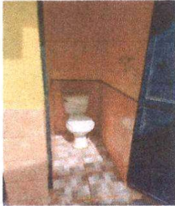
Foto 1: Sustitución de inodoros. Suministro e instalación de energía eléctrica en sanitario.