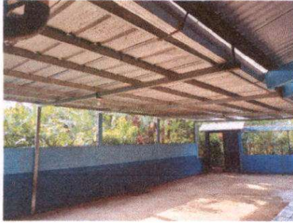
Foto 1: Sustitución de cubierta de lámina en patio y mantenimiento a estructura de metal. Sustitución de malla galvanizada por muro de block. Pintura en exterior e interior de muro perimetral.