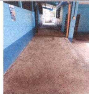
Foto 6: Sustitución de piso de torta de concreto por piso cerámico en corredor de aulas.

Observación: Si es necesario se pueden agregar hojas adicionales y actualizar el número de hojas.