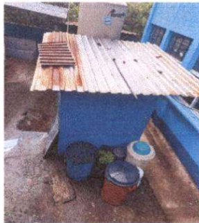
Foto 3: Sustitución de cubierta de lámina en baños y mantenimiento a estructura de metal.