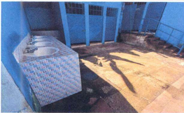
Foto 9: Sustitución de piso de torta de concreto de área exterior de servicios sanitarios.