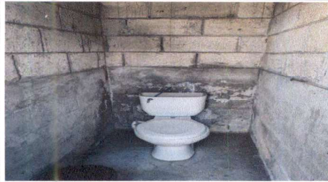
Foto7: Suministro e Instalación de piso Azulejo en sanitarios