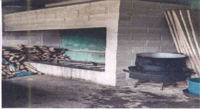
Foto1: Instalación piso cerámico antideslizante