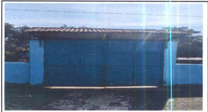
Foto 14: Mantenimiento de porton principal de metal de 3.00 x 3.50