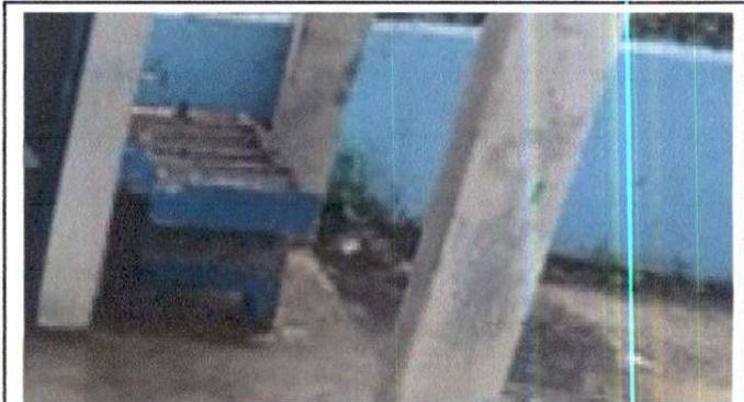
Foto 10: Instalación y Sustitución de pila Baby de concreto de 2 lavaderos con drenaje