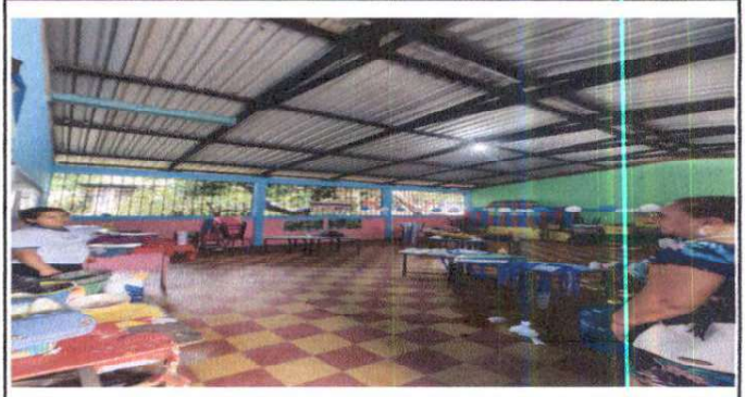
Foto 16: Sustitución de lámina, por lámina troquelada aluzinc calibre 26