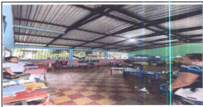
Foto 18: Sustrucción de estructura de soporte de madera, por metal en aula

Observación: Si es necesario se pueden agregar hojas adicionales y actualizar el número de hojas.