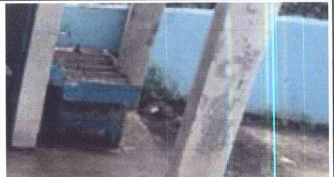
Foto 10: Instalación y Sustitución de pila Baby de concreto de 2 lavaderos con drenaje