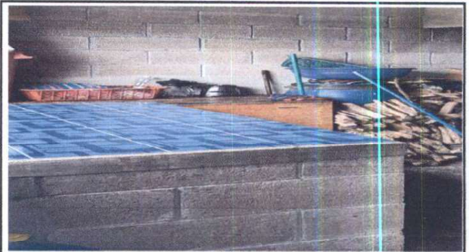
Foto 2: Suministro e instalación de Azulejo en mesa de concreto de cocina