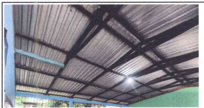
Foto 17: Sustrucción de cubierta de lámina, por lámina troquelada aluzinc calibre 26