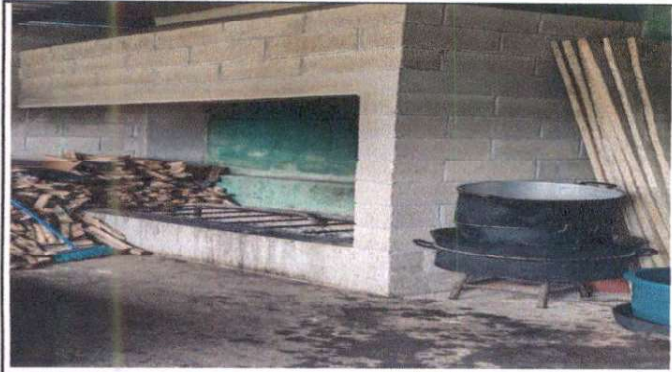
Foto1: Instalación piso cerámico antideslizante