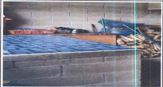
Foto 2: Suministro e instalación de Azulejo en mesa de concreto de cocina