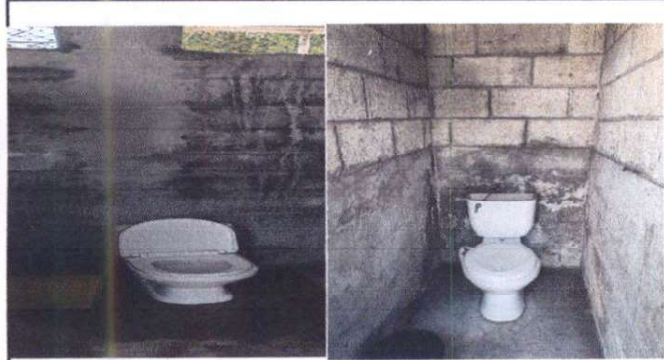
Foto7: Sustitución inodoro incluye accesorios