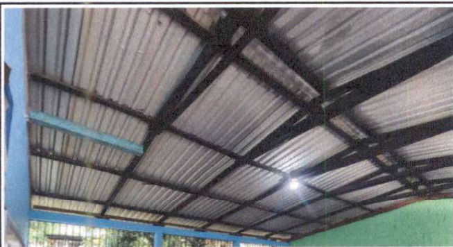
Foto 17: Sustitución de lámina, por lámina troquelada aluzinc calibre 26