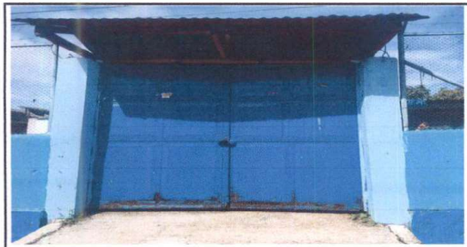
Foto 15: Sustrucción de estructura de soporte de lámina, por lámina troquelada aluzinc calibre 26 en porton principal