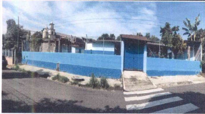
Foto 19: Reparación de muro perimetral de block con tubo hg y malla galvanizada, soleras intermedias y columnas