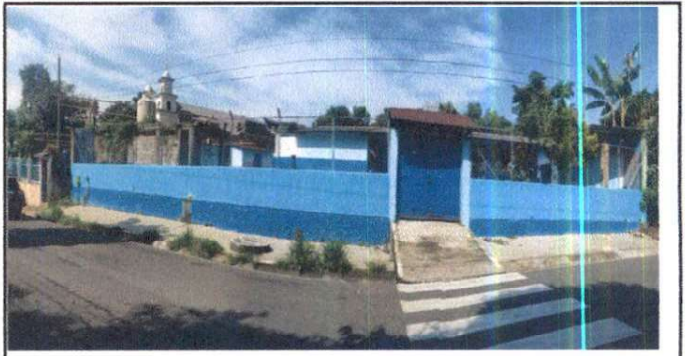
Foto 18: Reparación de muro perimetral de block con tubo hg y malla galvanizada, soleras intermedias y columnas.

Observación: Si es necesario se pueden agregar hojas adicionales y actualizar el número de hojas.