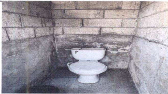
Foto 21: Cernido Gris parte interior en muros de sanitarios 14 ML