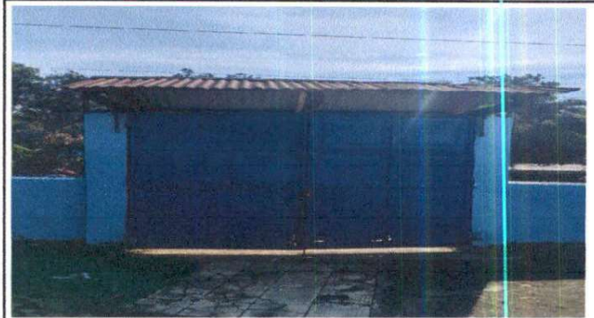
Foto 14: Sustitución de estructura de soporte de lámina, por lámina troquelada aluzinc calibre 26 en porton principal