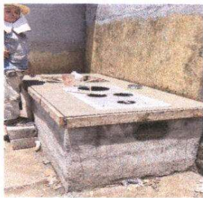
Foto 11: Instalación de estructura de metal e instalación de lamina y polleton