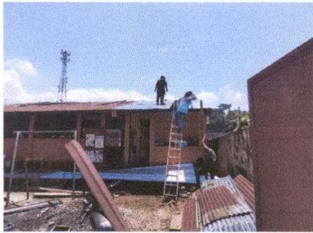
Foto 1: Sustitución y mantenimiento a estructura de sostenimiento de techo.