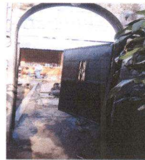
Foto 6: Mantenimiento a puerta principal al entrar al Centro educativo

Observación: Si es necesario se pueden agregar hojas adicionales y actualizar el número de hojas.