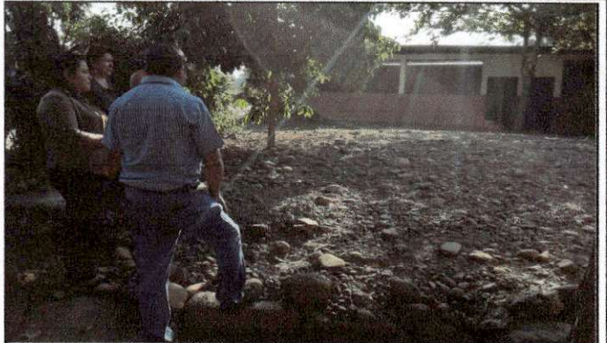
Foto 2: Vista del evaluador realizando la inspección del estado actual del patio del establecimiento y visualizar necesidades.