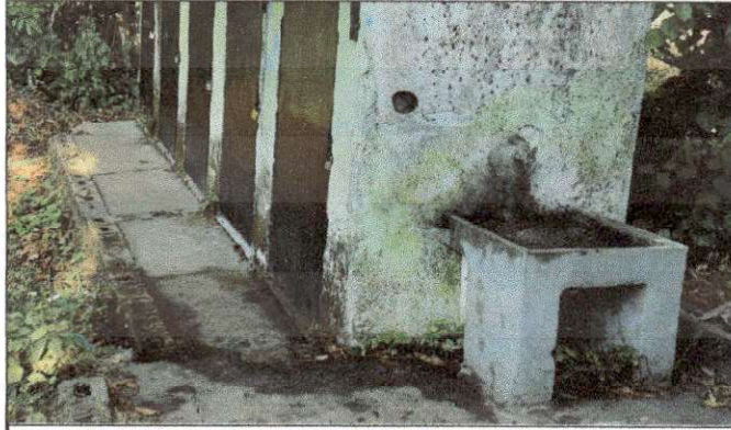
Foto 7: Estado actual de los servicios sanitarios, se solicita el mantenimiento y reparación de tuberías en dicha área.