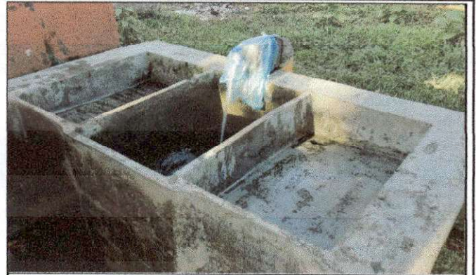
Foto 8: Solicitan la adecuación de un espacio para la bomba de agua, ya que actualmente se ubica en el espacio de la dirección.