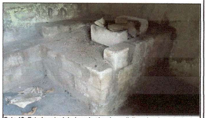
Foto 12: Estado actual de área de plancha, solicitan el mejoramiento de dicha área por temas de higiene.