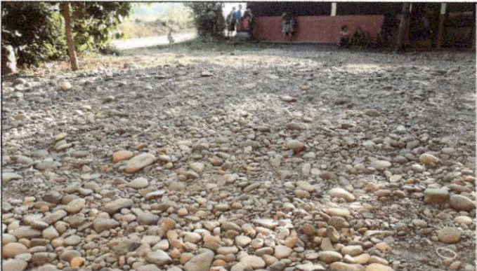
Foto 3: Estado actual del patio del establecimiento, solicitan la colocación de plancha de concreto en dicha área ya que los niños no cuentan con un espacio que garantice su seguridad.