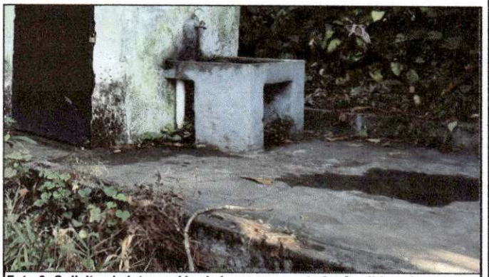
Foto 6: Solicitan la integración de lavamanos exterior fundido, además de la colocación de muro de cerramiento en dicha área, ya que se presentan problemas muy serios de seguridad.