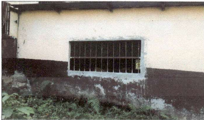
Foto 9: Estado actual de la pintura de los muros del establecimiento, solicitan la aplicación de pintura ya que la que se encuentra actualmente está desgastada.