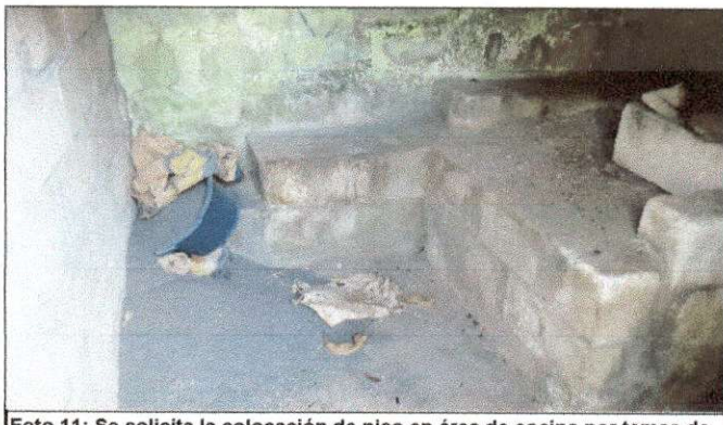
Foto 11: Se solicita la colocación de piso en área de cocina por temas de higiene al momento de preparar alimentos.