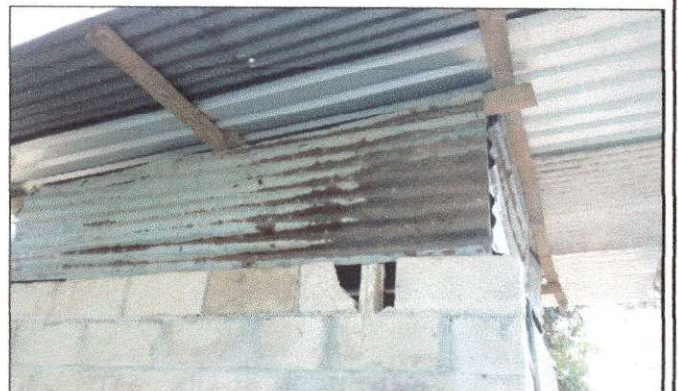
Foto 10: Debido a los problemas serios con relación a la seguridad, se solicita la finalización de muro en cocina.