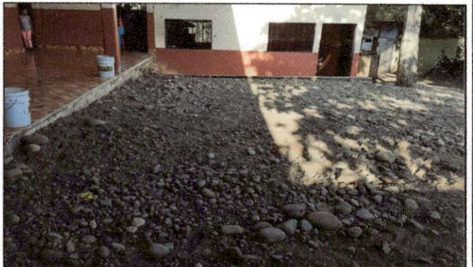
Foto 4: Estado actual del patio del establecimiento, solicitan la colocación de plancha de concreto en dicha área ya que los niños no cuentan con un espacio que garantice su seguridad.