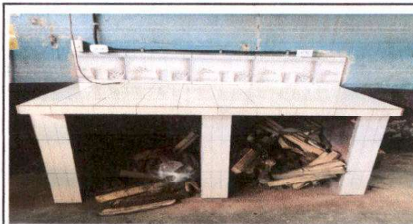
Foto 4: Sustitución de estufa rural (completa) incluye chimenea y plancha de metal 1.80 x 1.50 mts.