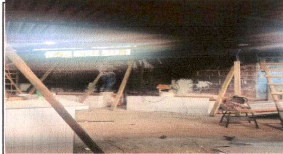
Foto 4: Sustitución de estufa rural (completa) incluye chimenea y plancha de metal 1.80 x 1.50 mts.