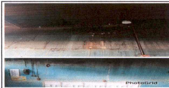
Foto 5: Sustitución de tomacorriente dobles, Focos ahorradores, interruptores simple, ducto eléctrico, y cableado en cocina