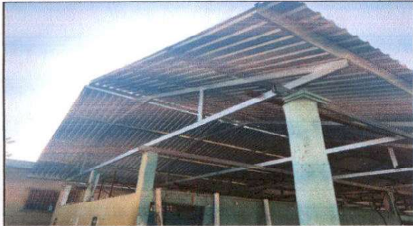
Foto 1: Sustitución de lámina, por lámina troquelada aluzinc calibre 26