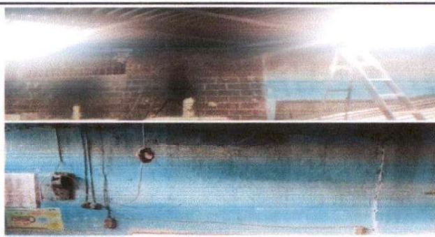
Foto 5: Sustitución de tomacorriente dobles, Focos ahorradores, interruptores simple, ducto eléctrico, y cableado en cocina