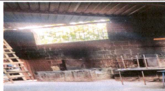
Foto 4: Sustitución de estufa rural (completa) incluye chimenea y plancha de metal 1.80 x 1.50 mts.