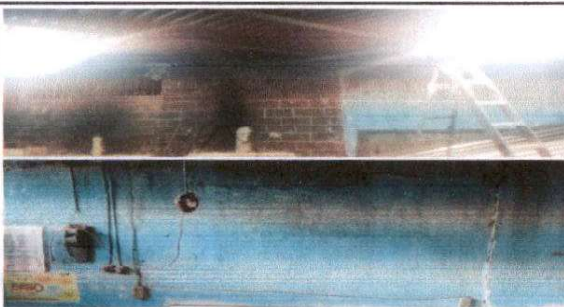
Foto 5: Sustitución de tomacorriente dobles, Focos ahorradores, interruptores simple, ducto electrico, y cableado en cocina