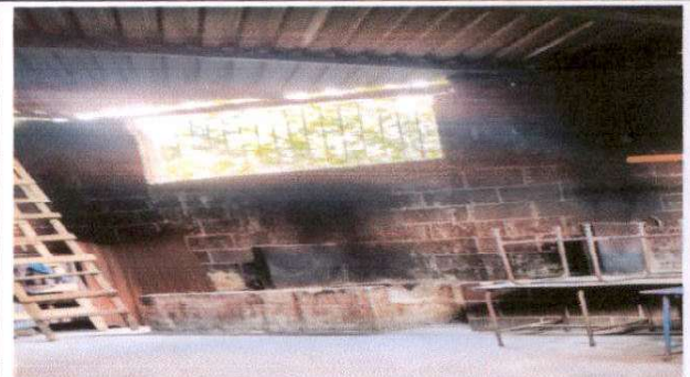
Foto 4: Sustitución de estufa rural (completa) incluye chimenea y plancha de metal 1.80 x 1.50 mts.