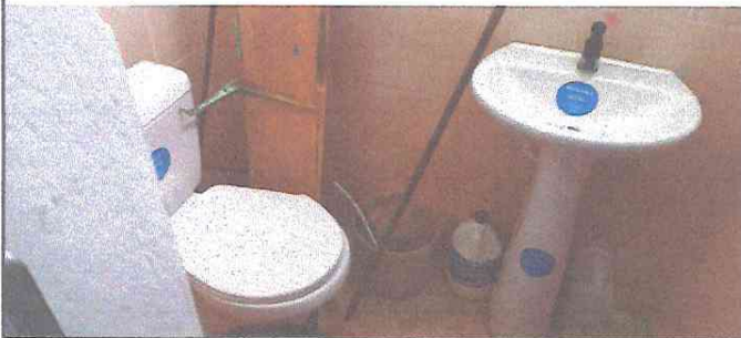
Foto 5: sustitucion de baños y lavamanos del aula de parvulos 2 A.