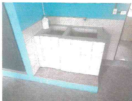
foto 4. Instalacion de azulejos en pila de cocina