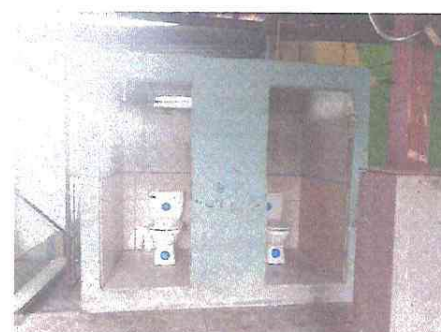
Foto 6. sustitucion de dos baños, azulejos y puertad del segundo nivel

Observación: Si es necesario se pueden agregar hojas adicionales y actualizar el número de hojas.