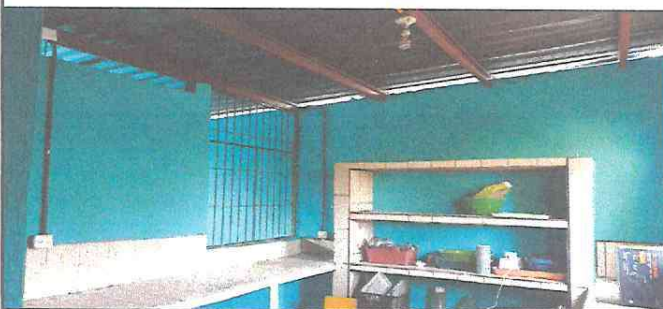
Foto 2. instalacion de azulejos en muebles de cocina