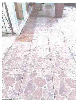
foto 5. sustitucion de piso de granito por piso antideslizante