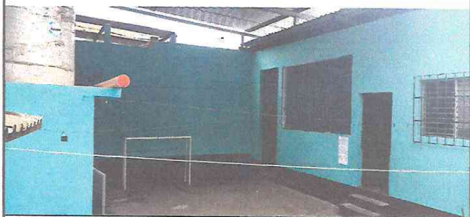
Foto 2. Pintura de paredes de la escuela