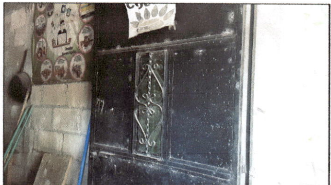
Foto 4: Se solicita el cambio de puerta metálica que se encuentra en estado de deterioro.