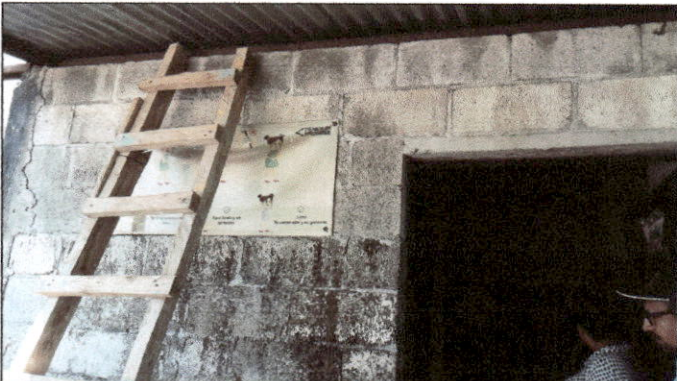
Foto 3: Debido al poco espacio y la poca ventilación con la que cuenta el área de cocina, se solicita la demolición de muro para la ampliación de esta misma.