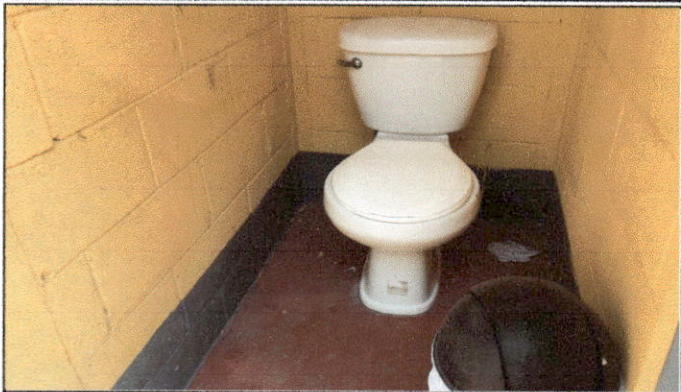
Foto 7: Se solicita el cambio de inodoros que se encuentran en mal estado, además de la colocación de piso para el mejoramiento de la higiene.