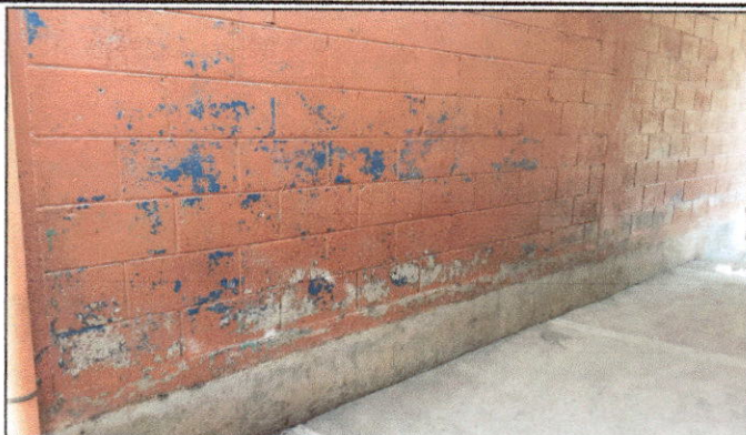
Foto 8: Estado actual de la pintura en muros del establecimiento, debido al desgaste de esta misma se solicita la aplicación de pintura.