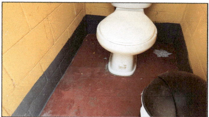
Foto 6: Estado actual de los servicios sanitarios, solicitan el mantenimiento y reparación de tuberías, ya que algunos inodoros se encuentran inhabilitados.