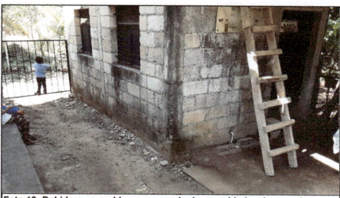
Foto 12: Debido a un problema muy serio de seguridad en la escuela y delincuencia en la zona, solicitan la colocación de muro de cerramiento en área de patio.