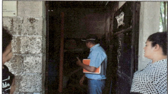
Foto 2: Vista del evaluador realizando la inspección del estado en el que se encuentra el área de cocina.