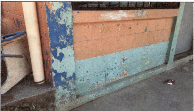
Foto 9: Estado actual de la pintura en muros del establecimiento, debido al desgaste de esta misma se solicita la aplicación de pintura.