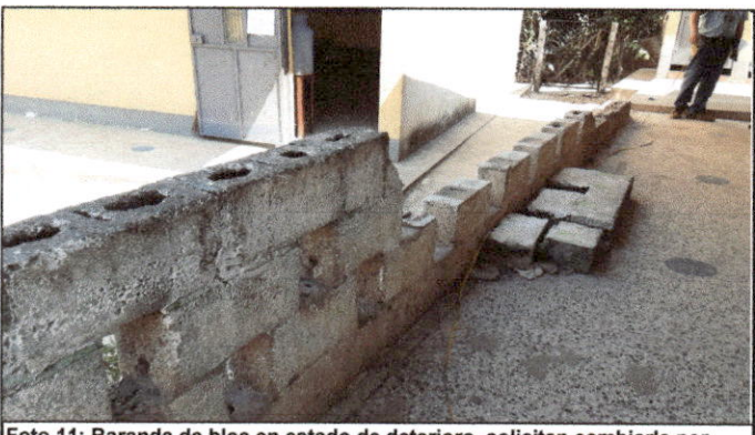
Foto 11: Baranda de bloc en estado de deterioro, solicitan cambiarla por baranda metálica por seguridad de los niños.