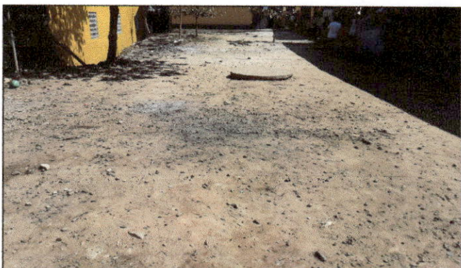
Foto 10: Debido a que los niños no cuentan con un espacio al aire libre que garantice su seguridad, se solicita colocar torta de cemento en área de patio.