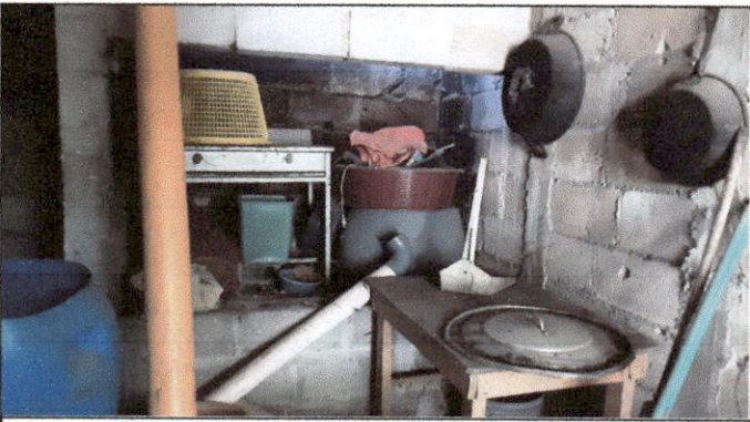
Foto 5: Se solicitan trabajos de remozamiento en área de cocina por temas de higiene al momento de preparar los alimentos.