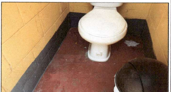
Foto 6: Estado actual de los servicios sanitarios, solicitan el mantenimiento y reparación de tuberías, ya que algunos inodoros se encuentran inhabilitados.