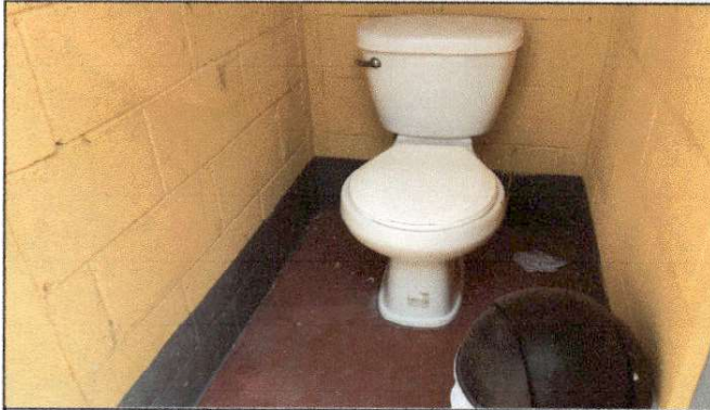
Foto 7: Se solicita el cambio de inodoros que se encuentran en mal estado, además de la colocación de piso para el mejoramiento de la higiene.