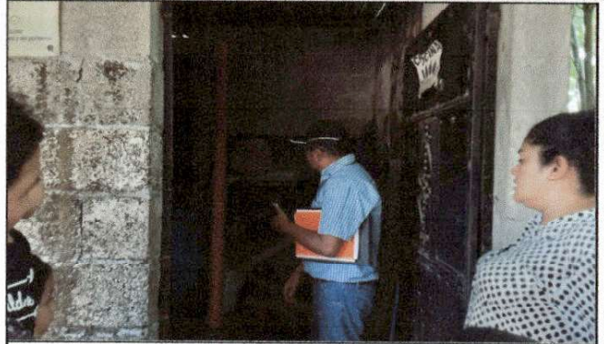
Foto 2: Vista del evaluador realizando la inspección del estado en el que se encuentra el área de cocina.