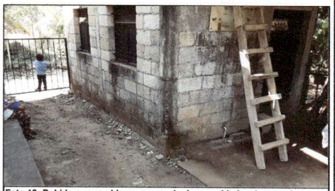
Foto 12: Debido a un problema muy serio de seguridad en la escuela y delincuencia en la zona, solicitan la colocación de muro de cerramiento en área de patio.