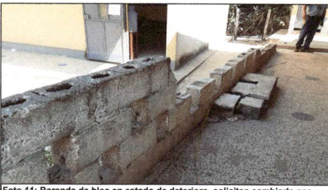
Foto 11: Baranda de bloc en estado de deterioro, solicitan cambiarla por baranda metálica por seguridad de los niños.