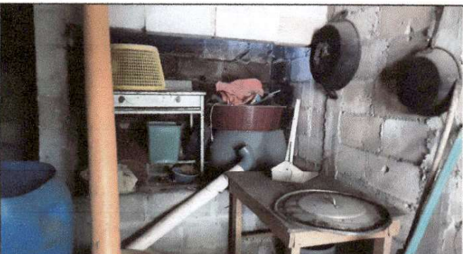
Foto 5: Se solicitan trabajos de remozamiento en área de cocina por temas de higiene al momento de preparar los alimentos.