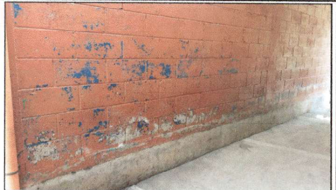
Foto 8: Estado actual de la pintura en muros del establecimiento, debido al desgaste de esta misma se solicita la aplicación de pintura.