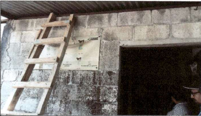
Foto 3: Debido al poco espacio y la poca ventilación con la que cuenta el área de cocina, se solicita la demolición de muro para la ampliación de esta misma.