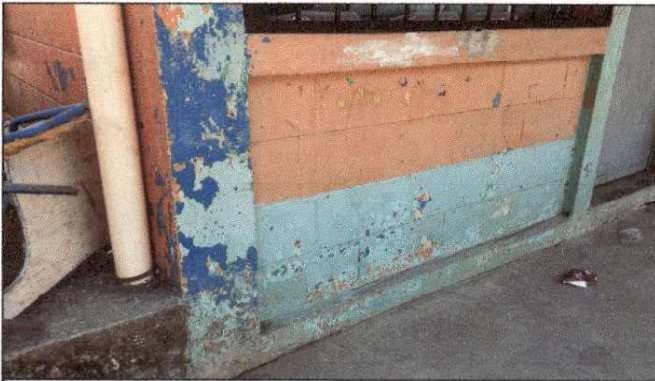
Foto 9: Estado actual de la pintura en muros del establecimiento, debido al desgaste de esta misma se solicita la aplicación de pintura.