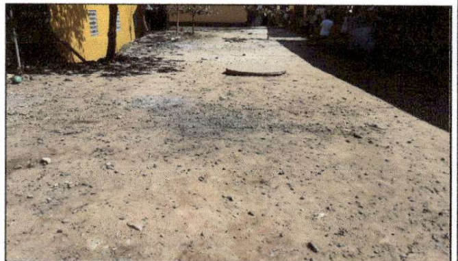
Foto 10: Debido a que los niños no cuentan con un espacio al aire libre que garantice su seguridad, se solicita colocar torta de cemento en área de patio.