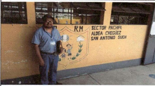
Foto 1: Vista del evaluador frente al rótulo de identificación de la escuela en cuestión.