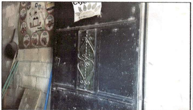
Foto 4: Se solicita el cambio de puerta metálica que se encuentra en estado de deterioro.