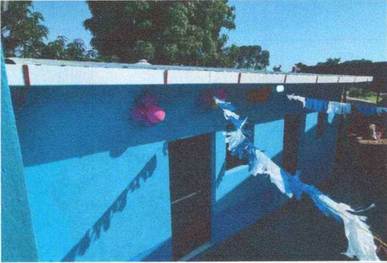
Foto 1: CUBIERTA DE LAMINA, Se cambio el techo para mayor resistencia y durabilidad.