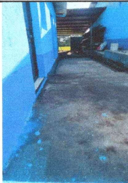
Foto 7. CUBIERTA DE CONCRETO. Se coloca una maqueta para evitar acumulación de agua y la humedad en la cocina.