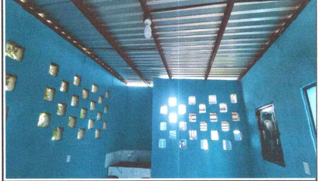
Foto 2: ESTRUCTURA DE TECHO, Se instaló una estructura metálica en el techo de la cocina para reforzar su seguridad y durabilidad.