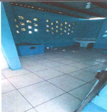
Foto 5: PISO, Se colocó piso a la cocina para proporcionar un mayor confort y bienestar.