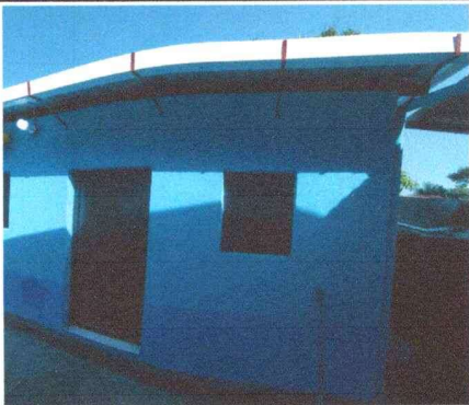
Foto 3: PUERTA, La cocina cuenta ahora con una puerta de metal más segura y duradera.