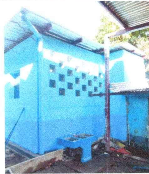
Foto 12: REPARACIÓN DE REPELLO Y CERNIDO DE PAREDES. Se prepara la pared para la aplicación de repello y cernido, con el fin de impermeabilizarla y protegerla contra la humedad.

Observación: Si es necesario se pueden agregar hojas adicionales y actualizar el número de hojas.