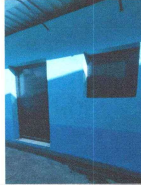
Foto 4: VENTANA La cocina cuenta ahora con ventana de metal más segura y eficiente.