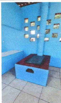
Foto 11: REPARACIÓN DE COCINA; Se llevará a cabo la reparación de la estufa de lena, incorporando una plancha y chimenea para mejorar su rendimiento y seguridad.