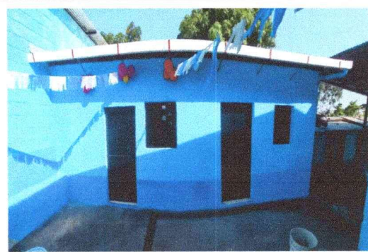
Foto 10. MANO DE OBRA ESPECIALIZADA. Se manda a fabricar Puertas, Ventana, Estructura, portante, láminas e instalaciones eléctricas y desinstalación de estructura y lámina.