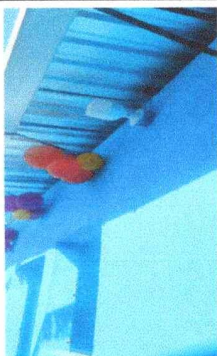
Foto 9. REPARACIÓN DEL SISTEMA ELÉCTRICO. La lámpara, la plafonera, y el cableado fueron reemplazados para garantizar la seguridad y eficiencia en la cocina.