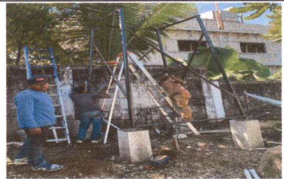
Foto 4: Sustitución de depósito de agua 1,100 lt. (incluye accesorio), Suministro e instalación de base de concreto y estructura de metal y de deposito de agua.