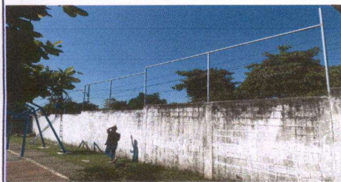
Foto 3: Sustitución e Instalación de malla galvanizada y tubo hg.