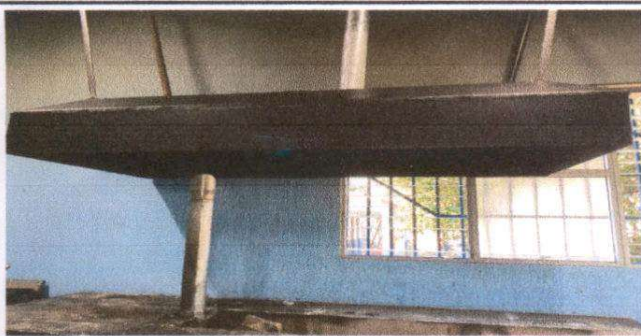
Foto 5: Sustitución e Instalacion de chimenea de metal (tipo campana)