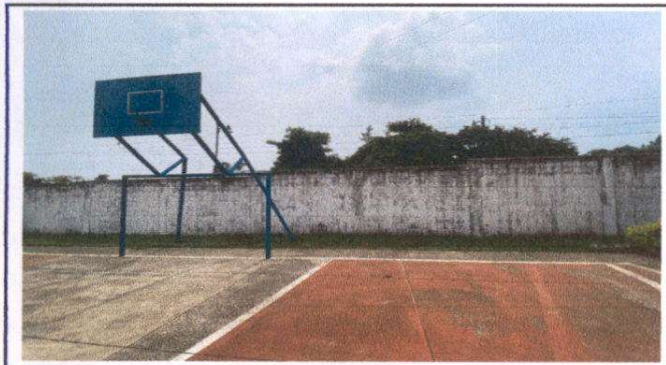
Foto 3: Sustitución e instalación de malla galvanizada y tubo hg.