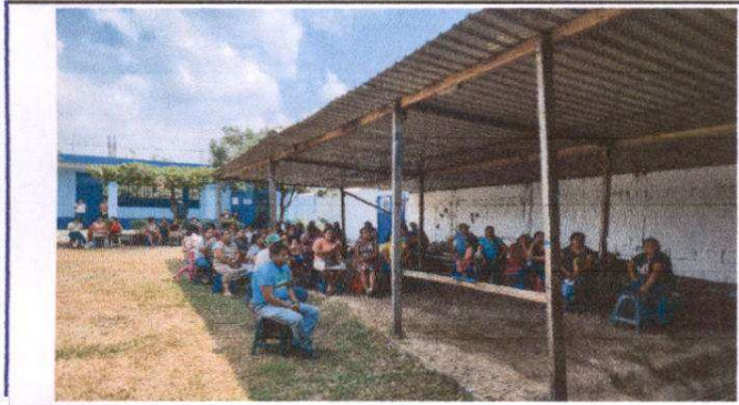
Foto 1: Sustitución de lámina, por lámina troquelada aluzinc calibre 26 de paraa de patio, sustitución de piso de torta de concreto y repello de muro perimetral.