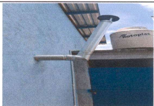
Foto 4: Sustitución de deposito de agua 1,100 lt. (incluye accesorio), Suministro e instalación de base de concreto de deposito de agua.