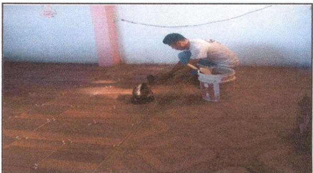
Foto 4: Colocación de piso cerámico dentro de aula, con ello se logra un ambiente más agradable para los niños y niñas.