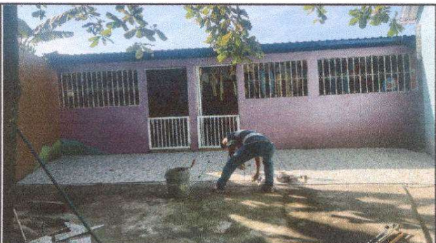
Foto 3: Colocación de piso antideslizante en el patio del establecimiento.