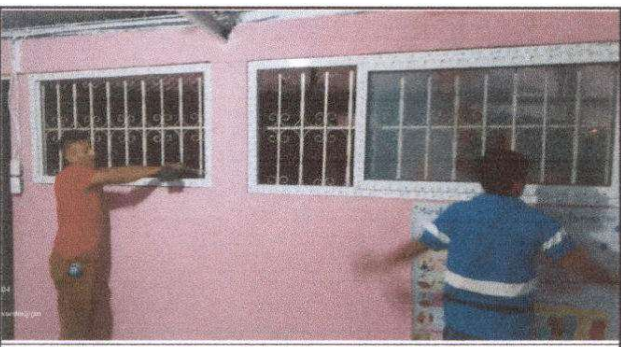
Foto 5: El personal encargado realizó la colocación de las demás ventanas corredizas en los salones de clases.