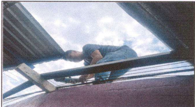
Foto 2: Desinstalación e instalación de láminas troqueladas, para ofrecer un mejor ambiente a los estudiantes.