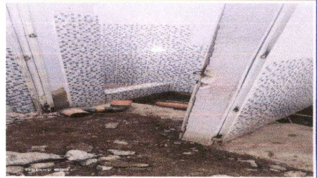
Foto 2: Inodoros de nivel preprimario con mal funcionamiento en drenaje