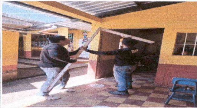
Foto1: Puertas de madera de aulas en malas condiciones