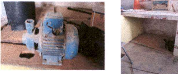
Foto 5: Desinstalacion de bomba de agua de pozo de 1/2 HP y suministro e instalación de puertas pvc de cocina.