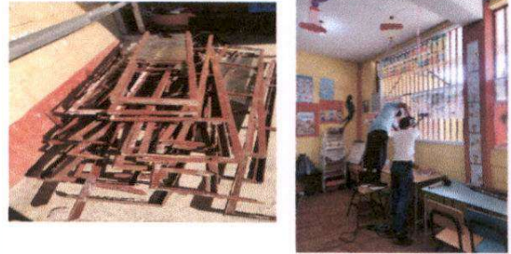
Foto 2: sustitucion y Colocacion de Suministro de ventanas pvc de aulas y dirección.