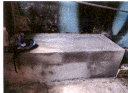
Foto 6: Elaboracion de estufa rural (completa) incluye chimenea y plancha de metal y sustitución de azulejo de estufa rural.

Observación: Si es necesario se pueden agregar hojas adicionales y actualizar el presente registro.