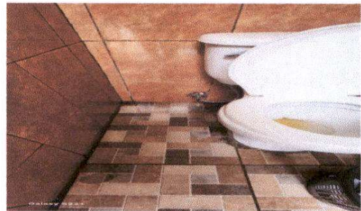
Foto 4: Sustitución de accesorios de inodoros (contra llave, tubo de abasto y tanque)