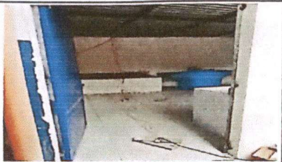
Foto 3: Sustitución de estufa rural, sustitución de azulejo en mesa de trabajo y sustitución de columnas de concreto armado de paredes y sustitución de pila.