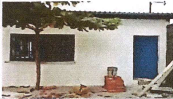
Foto 1: Sustitución de lámina por lámina troquelada aluzinc calibre 26, Sustitución de estructura de soporte de metal, Instalación de puertas de metal interior y exterior, instalación de ventanas, repello de paredes y cerramiento de pared de bloq. finchra dintel de ventanas)