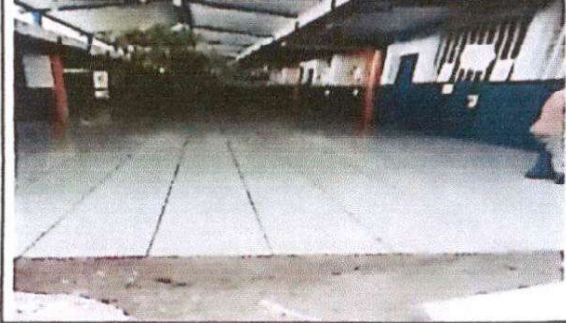
Foto 2: Sustitución de piso de torta de concreto y sustitución de piso antideslizante cerámico de corredor.