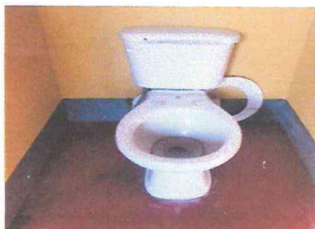
Foto 15: Sustitución de accesorios de inodoro (Contrallave, manguera de abasto y accesorios de tanque.