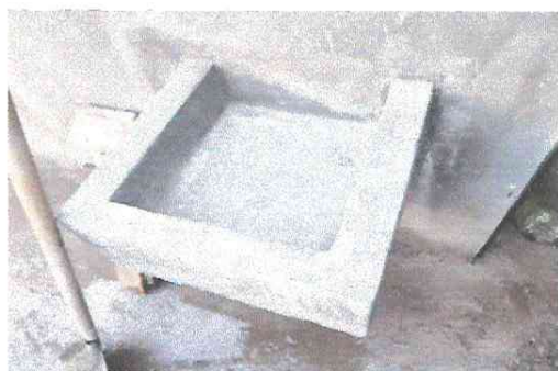
Foto17: Construcción de lavamanos en el área de cocina.