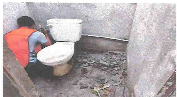
Foto 12: Sustitución de migitorio, de accesorios de inodoro (Contrallave, manguera de abasto, y accesorios de tanque, sustitución de tapaderas, sustitución de mezcladora para ducha). Pintura de muros interiores y exteriores de muro perimetral y baños).

Observación: Si es necesario se pueden agregar hojas adicionales y actualizar el número de hojas.