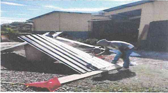
Foto 7: Mantenimiento a estructura de soporte de metal de la cocina (Lijado y pintura de costaneras y láminas),