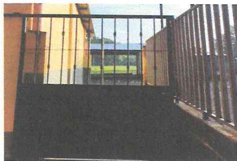
Foto 16: Sustitución de puerta (reja) por puerta con lámina lisa.