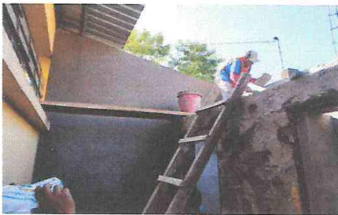
Foto 11: Cerramiento de muro con levantado de block en muro perimetral adjunto al servicio sanitario y Mantenimiento a puertas 0.75 x 1.80 M (Lijado, cepillado, aplicación de pintura).