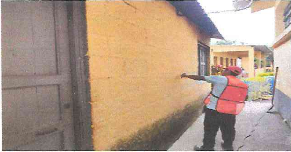
Foto 1: Sustitución de puerta de madera por metal, repello, cernido en cocina.