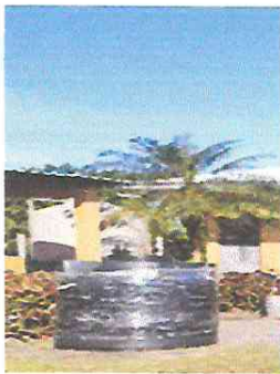
Foto 9: Sustitución de depósito de agua por uno de 1700 litros (Incluye accesorios).