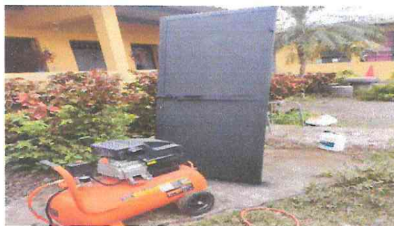
Foto 14: Mantenimiento de puertas, (Lijado, cepillado aplicación de pintura).