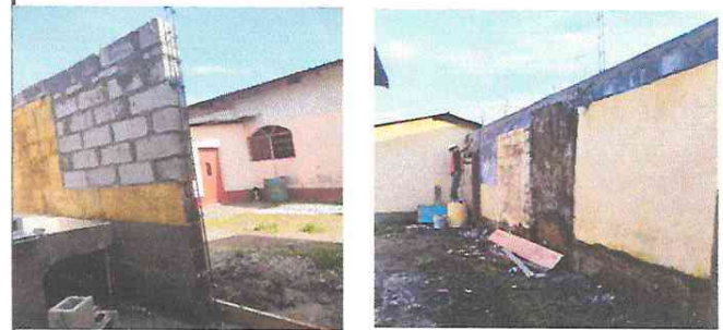
Foto 10: Sustitución de puerta de metal de 1.20 x 2.10 M se realizo el cambio por puerta de gabinetes de cocina.