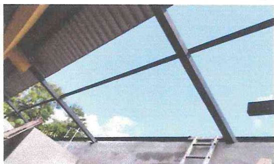
Foto13: Sustitución de lamina por lámina troquelada calibre 26.