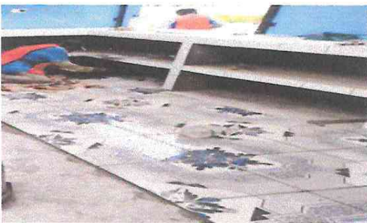
Foto 5: Sustitución de piso de concreto alisado por piso cerámico e instalación de azulejo en muebles de cocina.