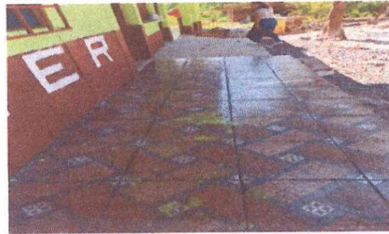
Foto 2: Reparación de banqueta de concreto y suministro de piso cerámico en cocina y sustitución de baldosas de concreto por piso de patio en corredor.