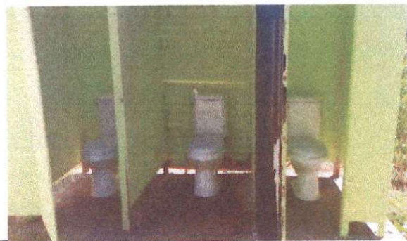
Sustitución de inodoro.

Observación: Si es necesario se pueden agregar hojas adicionales y actualizar el número de hojas.