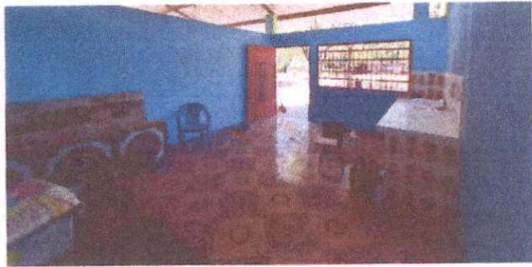
Foto 1: Reparación de cocina. Sustitución de malla galvanizada por muro de block. Sustitución de polletón de 1.80 x 1.00, Suministro de mueble fijo de concreto revestido de azulejo.