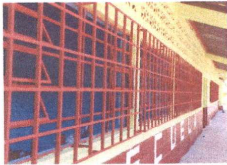
Foto 3: Suministro e instalación de balcón de metal en cocina, mantenimiento a balcón de aulas.