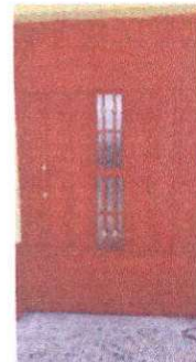
Foto 4: Sustitución de puerta de madera por puerta de metal de 2.10 x 1.00 mts