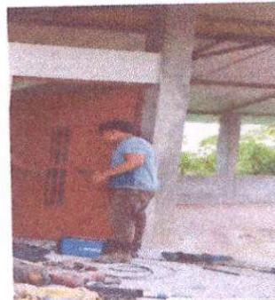
Foto 4: Sustitución de puerta de madera por puerta de metal de 2.10 x 1.00 mts