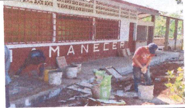
Foto 2: Reparación de banqueta de concreto y suministro de piso cerámico en cocina y sustitución de baldosas de concreto por piso de patiko en corredor.