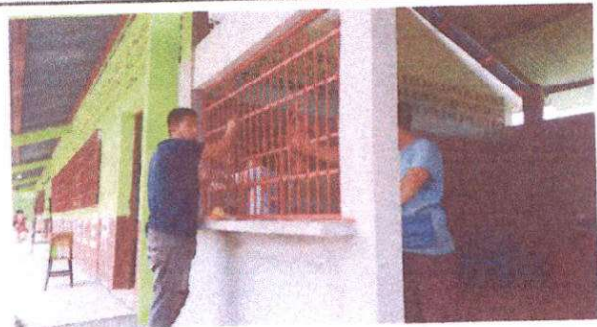
Foto 3: Suministro e instalación de balcón de metal en cocina, mantenimiento a balcón de aulas.