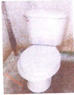
Sustitución de inodoro.

Observación: Si es necesario se pueden agregar fotografías y actualizar el número de hojas.