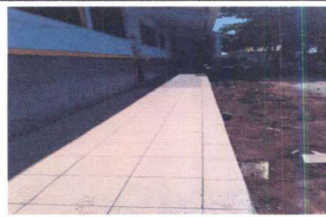
Foto 6: Sustitución de piso de granito por piso de patio en corredor de aulas. Sustitución de lámina y estructura de techo de aulas.

Observación: Si es necesario se pueden agregar hojas adicionales y actualizar el número de hojas.