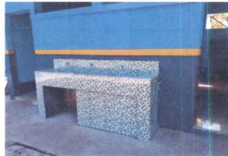
Foto 4: Suministro de lavamanos fijo de concreto de 1.75 x 0.45 en área exterior de sanitarios.