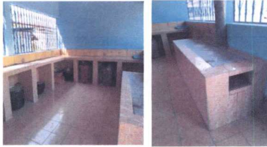
Foto 1: Suministro de estufa rural de 2 x 0.90 x 0.60 mts. Suministro de eszulejo en parte inferior de mueble fijo de concreto. Suministro de puerta demetal para gabinete de cocina.