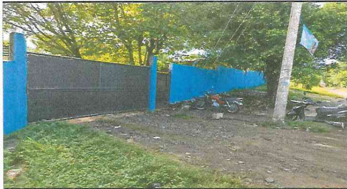
Foto 1: Reparación de muro perimetral de enfrente, mantenimiento de porton con lámina lisa, mantenimiento de puerta principal con lámina lisa.