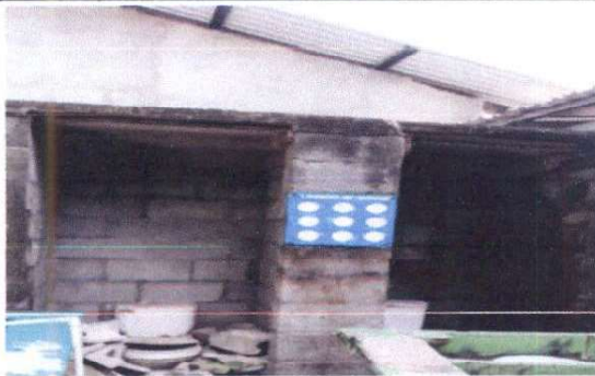
Foto 5: Sustitución de pila de dos lavaderos con su sistema de tubo de drenaje 5 ML