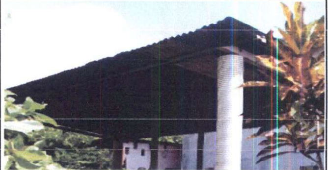
Foto 2: Sustitución de lámina, por lámina troquelada aluzinc calibre 26 en el modulo de cocina