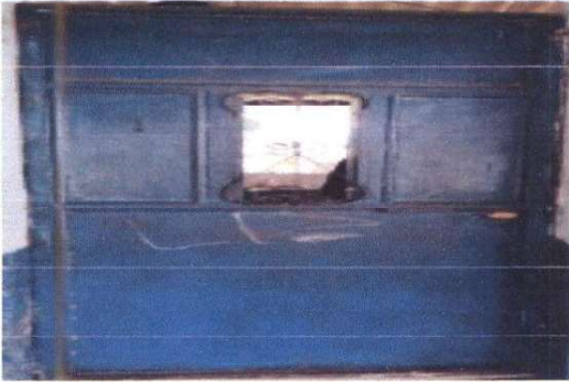
Foto1: puerta 2.10 X 0.85 M2 en el modulo de baños incluye mano de obra