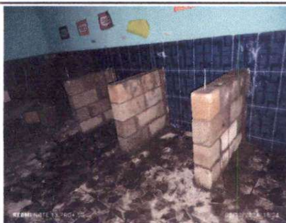
Foto 5: Suministro de mesa de concreto fundido revestida de azulejos.