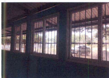
Foto1: Sustrucción de ventana, por ventana de pvc.