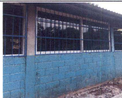
Foto2: Pintura en muros exteriores e interiores.