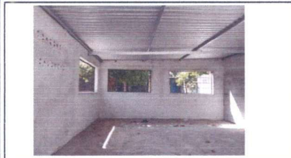
piso de cemento liso