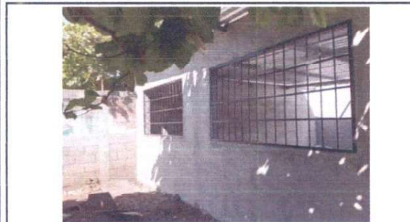
repello de la pared