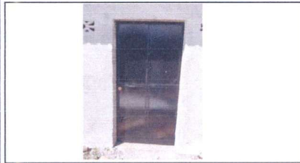
cambio de puerta dañada por puerta de metal nueva