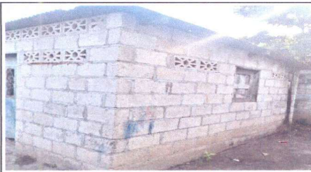
Foto 3: Sustitución de estructura de soporte de madera, por metal