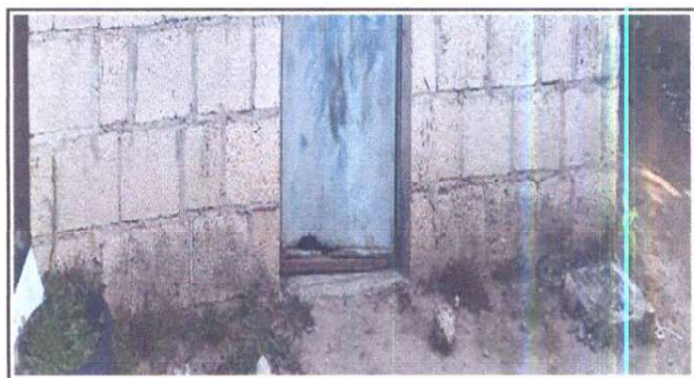
Foto 6: Sustitución de torta de concreto, por piso cerámico antideslizante

Observación: Si es necesario se pueden agregar hojas adicionales y actualizar el número de hojas.