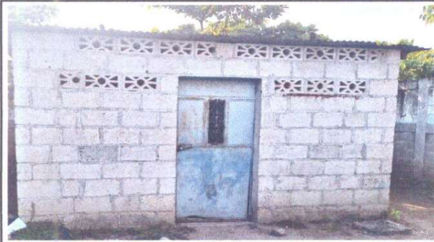
Foto 1: Sustitución de lámina, por lámina troquelada aluzinc calibre 26 Para cubrir modulo de baño, y modulo uno