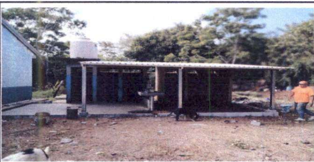
Foto 5: Reparación de puerta de baños, sustrucción de rotoplas, sustrucción de techo, construcción de lavamanos y techado.