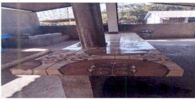
Foto1: Sustitución de plancha( plancha de 0.80 de ancho por 4.30 de largo y cerámico terminado)