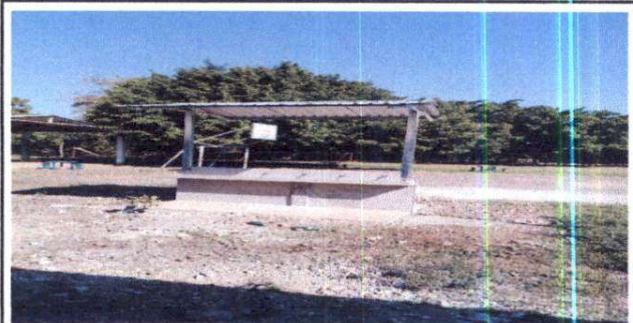
Foto 6: Sustrucción de chorro, construcción de lavamanos y techado

Observación: Si es necesario se pueden agregar hojas adicionales y actualizar el número de hojas.