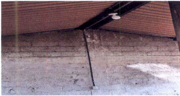
3. Sustitucion de sistema electrico.