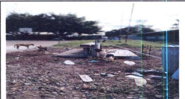
Foto 6: Sustitución de chorro, construcción de lavamanos y techado

Observación: Si es necesario se pueden agregar hojas adicionales y actualizar el número de hojas.