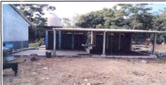
Foto 5: Reparación de puerta de baños, sustitución de rotoplas, sustitución de techo, construcción de lavamanos y techado.