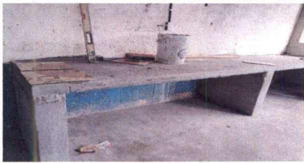
Foto1: Sustitución de plancha( plancha de 0.80 de ancho por 4.30 de largo y ceramico terminado)