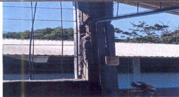
3. Sustitucion de sistema electrico.