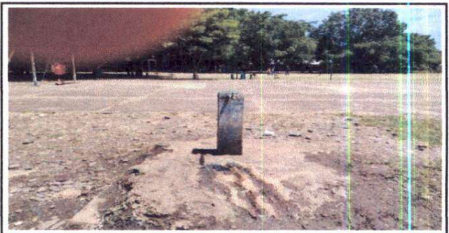
Foto 6: Sustrucción de chorro, construcción de lavamanos y techado

Observación: Si es necesario se pueden agregar hojas adicionales y actualizar el número de hojas.