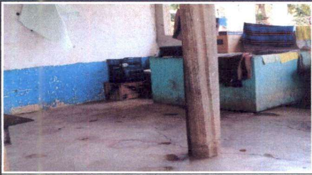
Foto 1: Sustitución de plancha( plancha de 0.80 de ancho por 4.30 de largo y cerámico terminado)