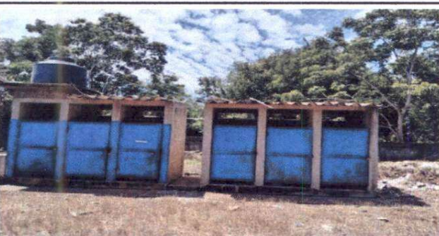
Foto 5: Reparación de puerta de baños, sustitución de rotoplas, sustitución de techo, construcción de lavamanos y techado.