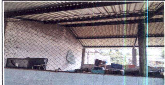
Foto 6: Sustitución de sistema electrico. Sustitución de malla galvanizada por electromalla

Observación: Si es necesario se pueden agregar hojas adicionales y actualizar el número de hojas.