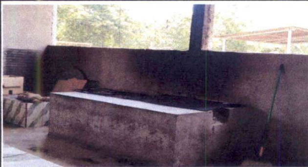
Foto 4: Sustitución de Polletón de cocina ( 3 mts de largo, 1 metro ancho, 60 centimetro de alto)