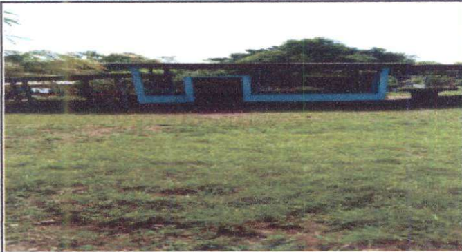
Foto1: Sustrucción de maya, por balcon.