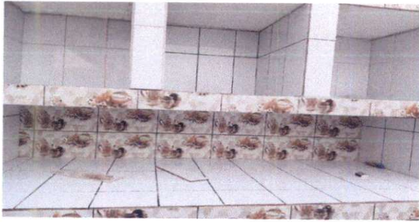
Foto1: gabinete en cocina terminado