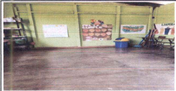
Foto 3: Sustitución de pared de plywood, por pared de block de concreto