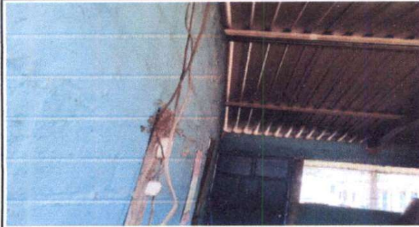
Foto 1: Sustitución de sistema eléctrico, (Incluye interruptor 10, ducto, cable, tomacorriente 10, flípones 10, en cocina, aula uno y aula dos