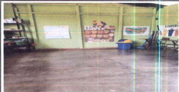
Foto 6: Sustitución de piso de granito, por piso cerámico, en cocina y aula uno

Observación: Si es necesario se pueden agregar hojas adicionales y actualizar el número de hojas.