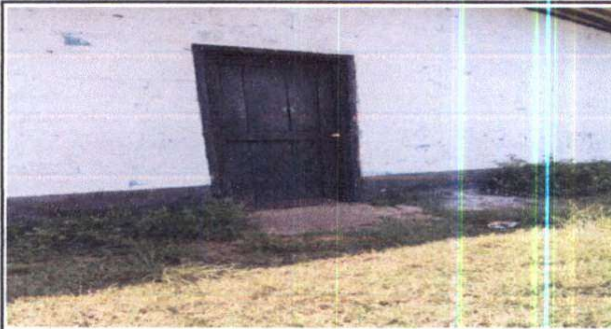
Foto 4: Sustitución de puerta de madera, por metal en cocina 1 X 0.70 metros