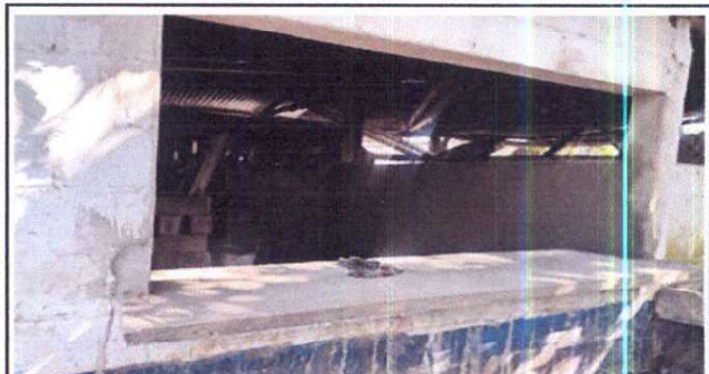
Foto 2: Sustitución de ventana de madera por metal avatible hacia arriba.