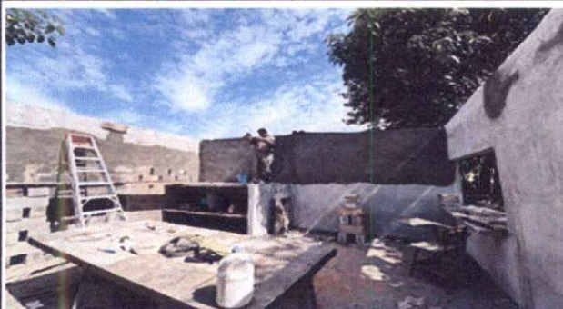
Foto 3: Suminsitro de pared de block para mejorar altura de techo