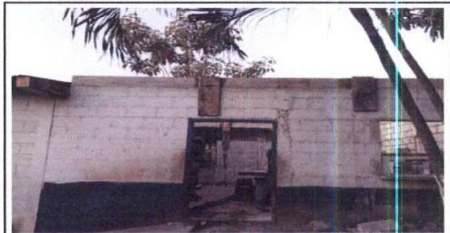
Foto 6: Sustitución de cubierta de lámina por lámina troquelada calibre 26

Observación: Si es necesario se pueden agregar hojas adicionales y actualizar el número de hojas.