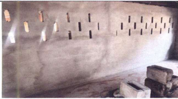
Foto1: Sustitución de repello y cernido