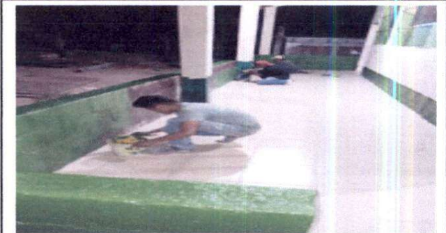
Foto 4: Sustitución de piso de concreto por piso cerámico en aulas y corredor