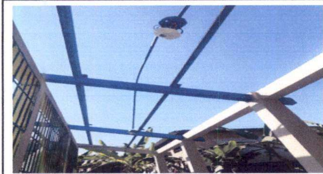
Foto 1: Sustitución de focos por focos LED y reparación de sistema eléctrico