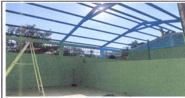
Foto 5: Sustitución de estructura de soporte de metal por metal en módulo de aulas