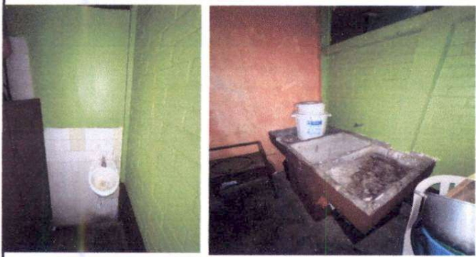
Foto1: Sustitución de lavamanos por batería de concreto