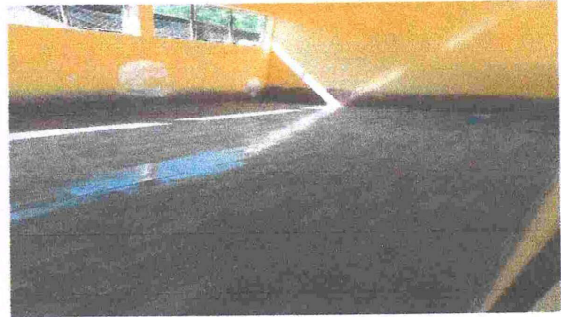
Foto 2: Sustitución de piso torta de cemento a piso cerámico en modulo de aula 2