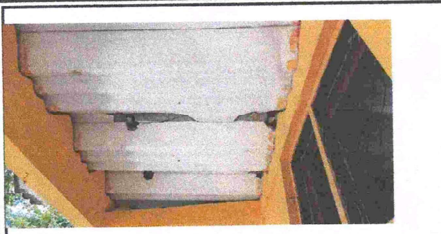
Foto1: Sustrucción de techo en modulo de aula 1