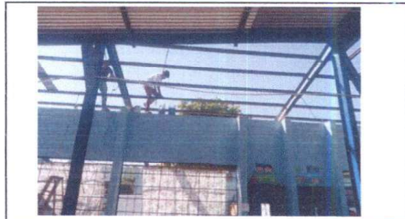
cambio de lamina