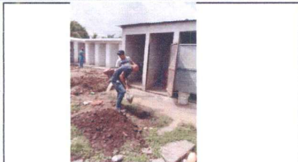
excavacion para la ubicacion de la tuberia de drenaje dañada