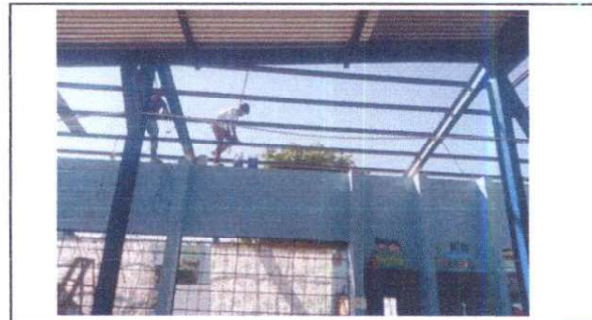
cambio de lamina