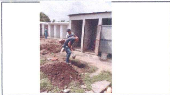
excavacion para la ubicacion de la tuberia de drenaje dañada