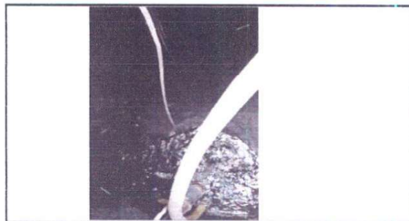
extraccion de desechos de la fosa septica

Observación: Si es necesario se pueden agregar hojas adicionales y actualizar el número de hojas.