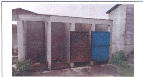
tuberia de agua y drenaje nueva