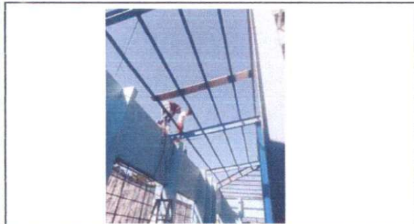
mantenimiento de la estructura