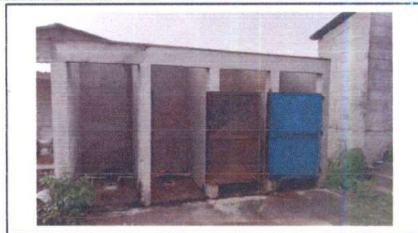
tuberia de agua y drenaje nueva