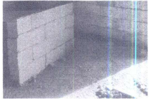
FOTO 2. Mesa de concreto