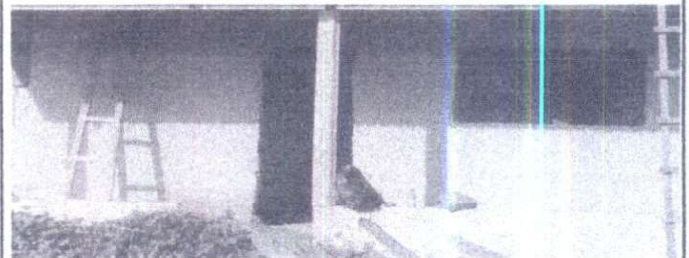
FOTO 6. Elaboración de puerta y ventana.

Observación: Si es necesario se pueden agregar hojas adicionales y adjuntar copias de hojas.