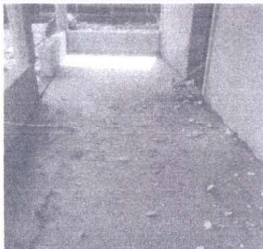
FOTO 3. Elaboración de torta de concreto.