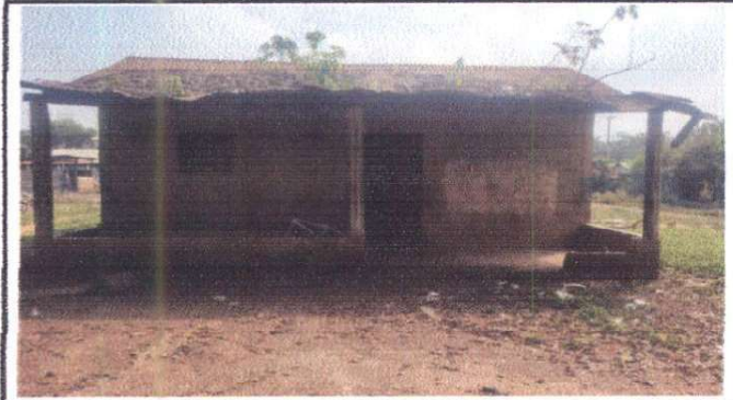
Foto1: Sustitución de cubierta de lámina por lámina troquelada calibre 26