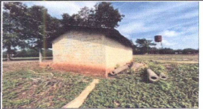
Foto 3: Suministro de pared de block para mejorar altura de techo