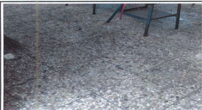
Foto1: Sustitución de piso de granit, por piso ceramico