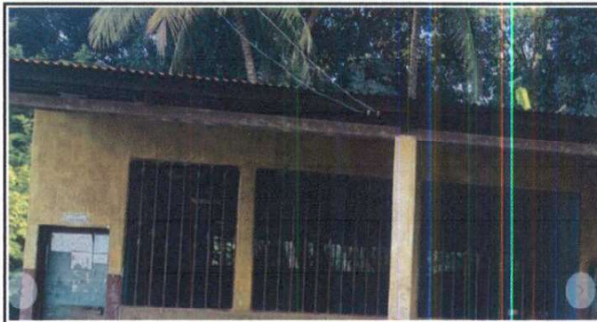
Foto 2: Sustitución de lámina, por lámina troquelada aluzinc caibre 26