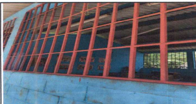
Foto 3: Instalación ducto eléctrico + accesorios (incluye) cable #. 12, focos ahorradores5, plafoneras 5, interruptores dobles 5, tomacorrientes dobles5