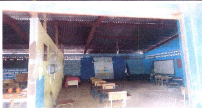
Foto1: Sustitución de sistema eléctrico