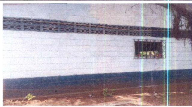
Foto 2: Ampliación de ventanas y sustitución de balcones de metal