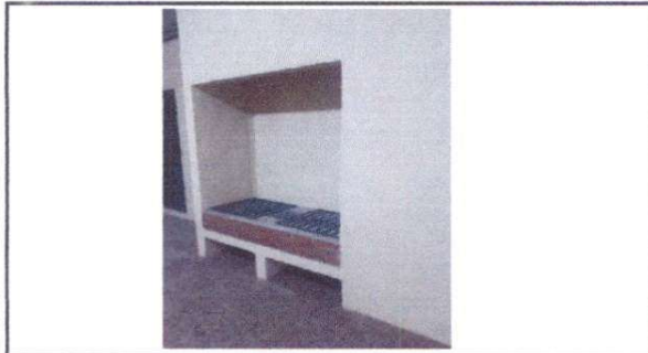
Reparación de polleton con cambio de lámina de chimenea, canal de agua pluvial