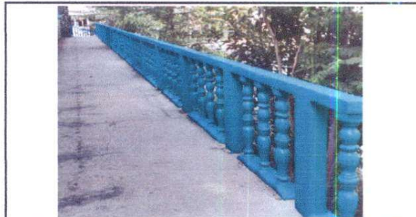
Reparación de pasamanos

Observación: Si es necesario se pueden agregar hojas adicionales y actualizar el registro de trabajos.