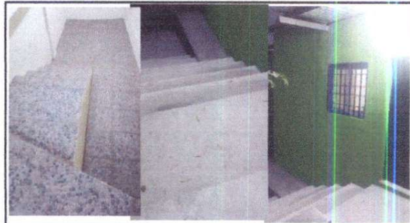
Instalación de puertas de metal