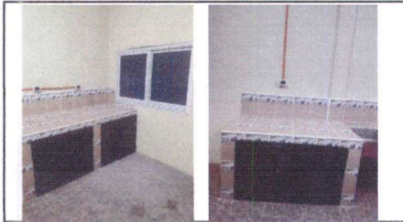
A nivelación de piso e instalación de piso cerámico, así como instalación de azulejo en muebles de la cocina.