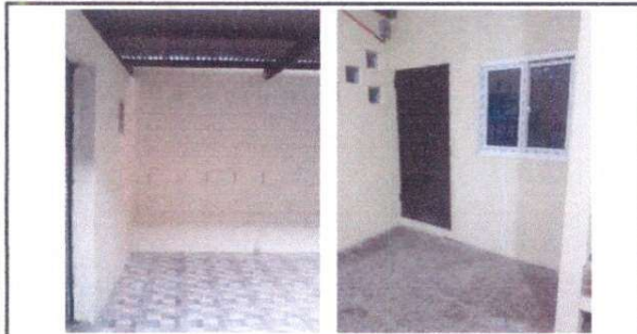
Instalación de piso cerámico en cocina, así como puertas y ventanas