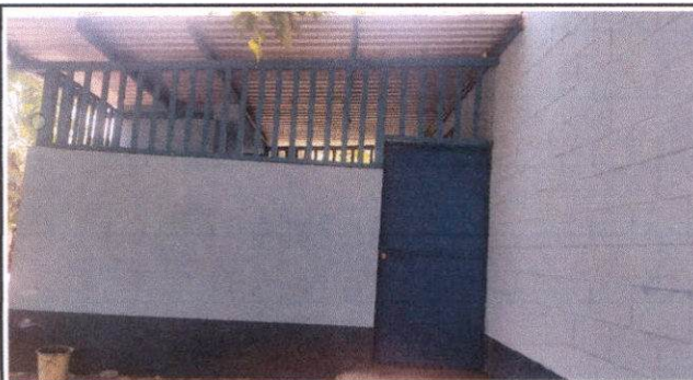
Sustitución de maya por balcones