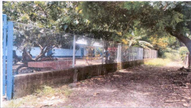
Reparación de muro perimetral con maya galvanizada, intermedios y columnas