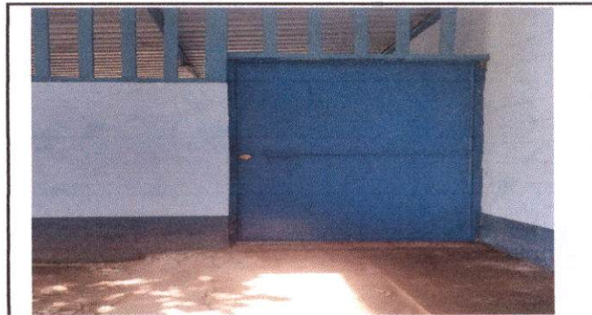
Reparación de puerta principal a cocina

Observación: Si es necesario se pueden agregar hojas adicionales y actualizar el número de hojas.