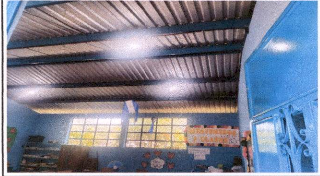
Sistema Electrico, cambio de lamparas