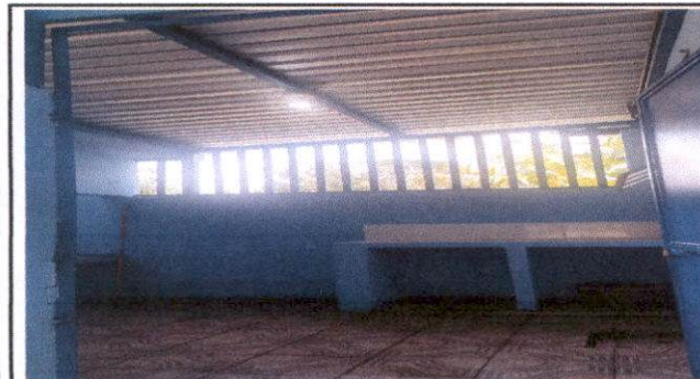
Reparación de cocina