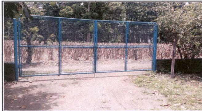
Sustitución de portón