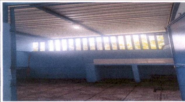
Reparación de Cocina