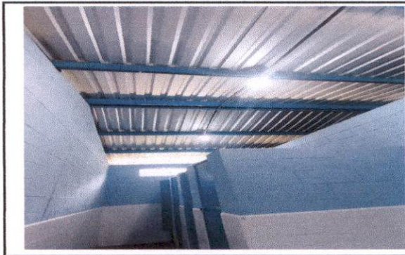
Cambio de lámina por picadura y oxidación