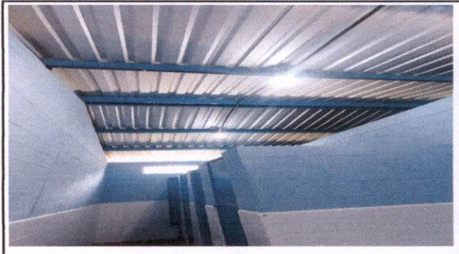
Sustitución de cubierta de lamina en el área de sanitarios