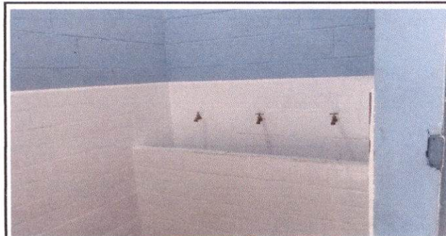
Sustitución de lavamanos

Observación: Si es necesario se pueden agregar hojas adicionales y actualizar el QR de las hojas.