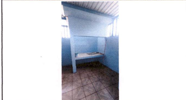
Construcción de poyetón