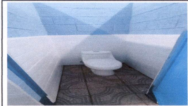
Sustitución de sanitario y sus accesorios