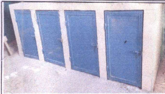
Foto1: Mesa de trabajo de concreto para cocina ya terminada