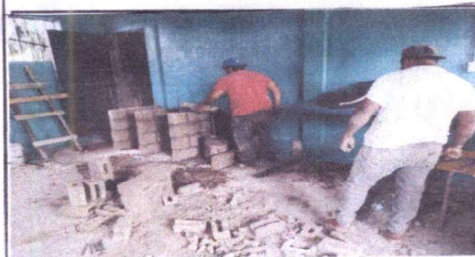
Foto 5: Proceso de construcción mesa de trabajo de concreto para cocina